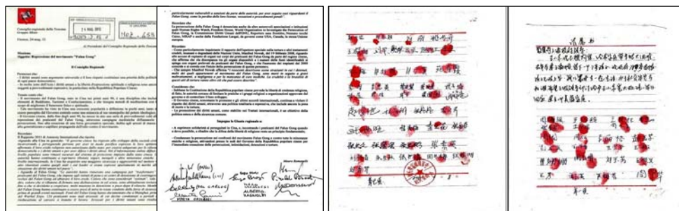
左：意大利佛罗伦萨省“停止迫害法轮功”议案；右：河北泊头三百多村民联名按手印、加盖公章要求释放法轮功学员，震动中共中央政治局。