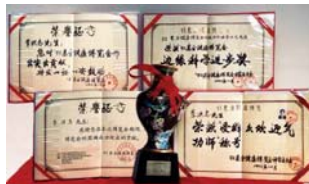
1993 年北京健康博览会上，李洪志先生获“边缘科学进步奖”和“受群众欢迎气功师”称号。

● 法轮大法弘传世界 法轮功已弘传一百多个国家，受到世界人民的爱戴和尊敬。李洪志先生和法轮大法因对人类身心健康做出的杰出贡献，获各国政府褒奖、支持议案 3000 多项。法轮功书籍被译成 30 多种语言在全球出版发行，并可在互联网上免费下载。◇