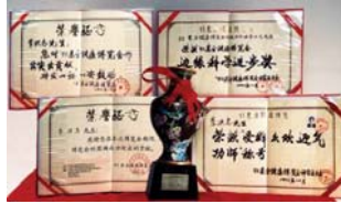
1993 年北京健康博览会上，李洪志先生获“边缘科学进步奖”和“受群众欢迎气功师”称号。

● 法轮大法弘传世界 法轮功已弘传一百多个国家，受到世界人民的爱戴和尊敬。李洪志先生和法轮大法因对人类身心健康做出的杰出贡献，获各国政府褒奖、支持议案 3000 多项。法轮功书籍被译成 30 多种语言在全球出版发行，并可在互联网上免费下载。◇