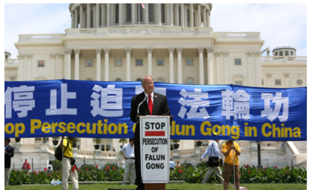
图：多位美议员在华盛顿 DC 国会山前集会上，呼吁制止中共对法轮功长达十三年的残酷迫害

新泽西州国会资深众议员克里斯托夫·史密斯在集会上说：“法轮功在遭受发生在中国的这种史无前例的残酷迫害和虐待时，始终充满勇气，无所畏惧，持久不懈地向世人讲清真相，赢得了世界巨大的尊重和敬意。”他说：“我和你们一道坚守人权。现在是美国政府和美国总统应该采取行动的时候了，制止发生在中国的对人权的公然践踏。”◇