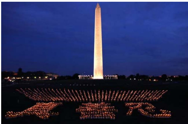
二零一二年七月十三日晚，华盛顿纪念碑前 法轮功学员举行十三年反迫害烛光夜悼

（明慧记者荷雨美国华盛顿 DC 采访报道）二零一二年“七二零”前夕，在法轮功反迫害第十三周年之际，五千多位不同文化背景的各族裔法轮功修炼者汇聚美国首都华盛顿 DC，他们通过各种公众活动呼吁世人在历史巨变时刻了解真相，制止中共迫害法轮功，为未来做出道义的选择。