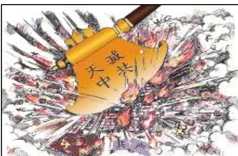
漫画：《珍惜生命 远离中共》

辽宁省抚顺市有一位老爷子，由于受中共造谣宣传的欺骗，再加上炼法轮功的女儿被中共迫害，因此，谁一跟他讲法轮功真相，他就大喊大叫，不准人家讲。一天，女儿给他出了一个问题：如果有人在墙上写“耍流氓”三个字，会有人管吗？老爷子马上回答：不会；女儿又问：如果写“真善忍”三个字呢？想了一下老爷子说：“会被抓起来。”女儿说：您看，这不邪吗？“啊”，老爷子明白了：看来中共真是邪呀。◇