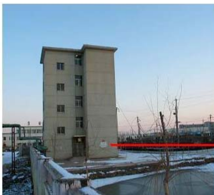
集输职工培训学校 职工宿舍楼

邪恶的集输洗脑班就设在集输职工培训中心宿舍楼五层，是强迫法轮功学员放弃信仰的非法机构，长期非法关押、勒索钱财、甚至非法劳教坚定信仰的法轮功学员。