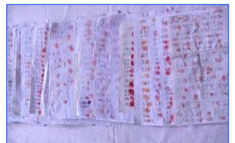
黑龙江 1.5 万人按手印替法轮功喊冤

2012 年 2 月 25 日，因修炼法轮功的王晓东被非法抄家、抢劫及抓捕，河北沧州泊头市富镇周官屯村全村 300 户各派一名代表在呼吁书上签名，要求市检察院释放王晓东，此联合签名按手印的请愿书在中共政治局引起震动。随后，河北唐海县 562 位村民按手印，支持释放法轮功学员郑祥星；近日黑龙江有 1.5 万民众为素不相识的法轮功学员挺身而出，站出来支持当地为父鸣冤的秦荣倩，在她的《喊冤昭雪书》上签名并按上大红手印。秦荣倩的父亲秦月明，因坚持信仰法轮功而被当局关在监狱中酷刑折磨致死。其中一份特殊的手印来自佳木斯监狱的