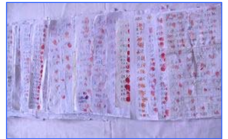
黑龙江 1.5 万人按手印替法轮功喊冤

2012 年 2 月 25 日，因修炼法轮功的王晓东被非法抄家、抢劫及抓捕，河北沧州泊头市富镇周官屯村全村 300 户各派一名代表在呼吁书上签名，要求市检察院释放王晓东，此联合签名按手印的请愿书在中共政治局引起震动。随后，河北唐海县 562 位村民按手印，支持释放法轮功学员郑祥星；近日黑龙江有 1.5 万民众为素不相识的法轮功学员挺身而出，站出来支持当地为父鸣冤的秦荣倩，在她的《喊冤昭雪书》上签名并按上大红手印。秦荣倩的父亲秦月明，因坚持信仰法轮功而被当局关在监狱中酷刑折磨致死。其中一份特殊的手印来自佳木斯监狱的