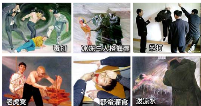
法轮功学员遭受的部分酷刑

名义上“610”是政府下属的一个办公室，可它并不是隶行政府职能的机构，干的是非法限定人身自由、劫持关押公民、指挥公安、安全局监听、监控、秘密绑架法轮功学员，干涉法律公正、强制洗脑、实施暴力、非法入侵民宅、策划恐怖行为、制造谎言、任意胡作非为、自立土政策，执有生杀大权。它既不隶政，建树政绩，它又超越宪法，取代法律，害民害国，是地地道道的非法组织。