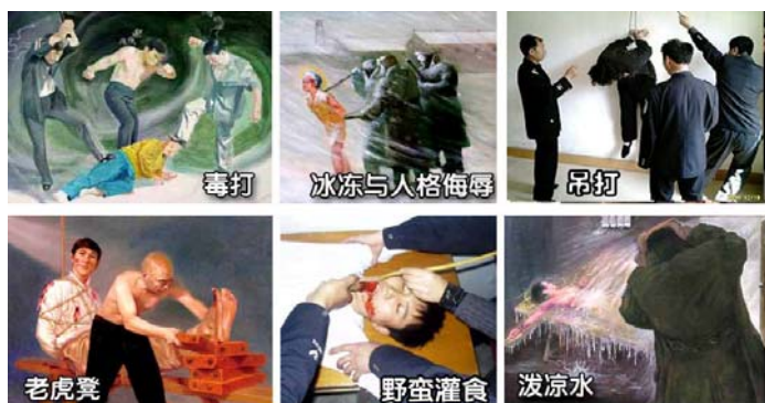
法轮功学员遭受的部分酷刑

名义上“610”是政府下属的一个办公室，可它并不是隶行政府职能的机构，干的是非法限定人身自由、劫持关押公民、指挥公安、安全局监听、监控、秘密绑架法轮功学员，干涉法律公正、强制洗脑、实施暴力、非法入侵民宅、策划恐怖行为、制造谎言、任意胡作非为、自立土政策，执有生杀大权。它既不隶政，建树政绩，它又超越宪法，取代法律，害民害国，是地地道道的非法组织。