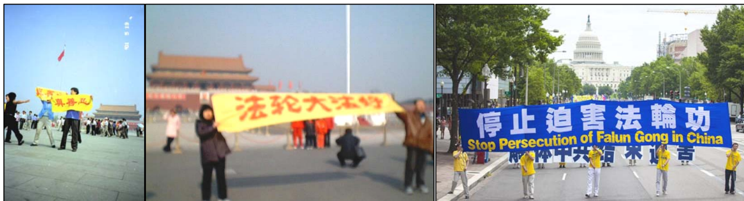
左 2 图：法轮功学员在天安门广场展示横幅和平请愿；右图：二零一二年七月十三日，来自欧、美、亚、澳等地的三千多名法轮功学员汇集美国首都华盛顿 DC 举行游行集会，抗议中共迄今长达十三年的惨无人道的迫害。

用海外电子信箱给 freeget.ip@gmail.com 发电子邮件，10 分钟内会拿到几个 IP 地址。突破网络封锁，访问明慧网 www.minghui.org ，了解更多真相。