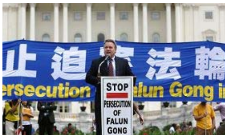
图: 美国国会人权委员会主席, 新泽西州国会议员克里斯托夫·史密斯在现场致辞时说: “目前身处中国的法轮功修炼者依然在遭受迫害。由于你们把发生在中国的活摘器官曝光出来, 才使我们和世人了解到这一骇人的迫害行径。它如此残酷, 是对人类道德的犯罪。”