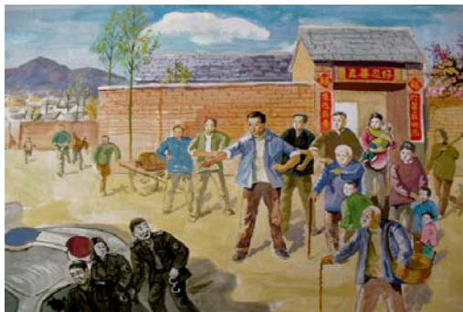
明慧网法轮大法弘传二十周年征稿选登《村民的觉醒》

几个同事去接孩子，都不给。晚上八点多了，一个去接孩子的同事说：“孩子再不给我们，我们也不来要了，出了什么问题你们负