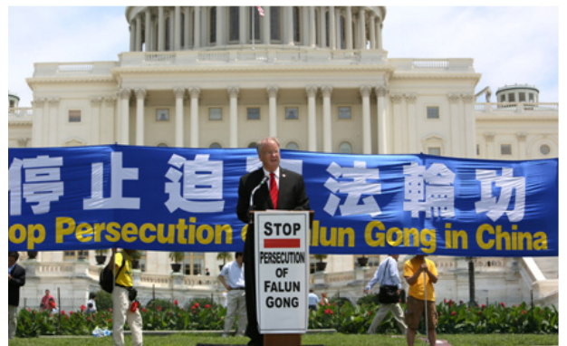
图：多位美议员在华盛顿 DC 国会山前集会上，呼吁制止中共对法轮功长达十三年的残酷迫害

新泽西州国会资深众议员克里斯托夫·史密斯在集会上说：“法轮功在遭受发生在中国的这种史无前例的残酷迫害和虐待时，始终充满勇气，无所畏惧，持久不懈地向世人讲清真相，赢得了世界巨大的尊重和敬意。”他说：“我和你们一道坚守人权。现在是美国政府和美国总统应该采取行动的时候了，制止发生在中国的对人权的公然践踏。”