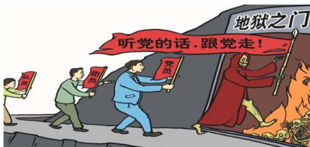
漫画：听党的话 跟党走 走入地狱门

罪行之四： 警察或其它等人，对法轮功学员施用肉刑（如，殴打，吊铐，捆绑，电击，以及其他折磨人的肉体的方法）或变相肉刑（如，冻、饿、烤、晒，强迫站着，蹲着，不让睡觉），逼取口供，逼迫法轮功学员承认强加的伪证，强迫法轮功学员承认强加的罪名，不管是否取得口供，构成了刑讯逼供罪。