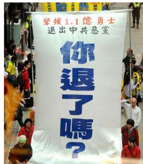
图：香港声援1亿1千万同胞三退（退党、团、队）。至7月1日，已有1亿1千万9百万中国民众在大纪元退党网站上声明三退。

还没有实现我们的目标，因为人权虐待仍然存在。但我们做的是提高认识，提高加拿大人的认识，提高内阁成员和国会议员的认识。我们在通过一种软性的外交方式，支持中国人权的斗争。”“作为加拿大国会议员，国会法轮功之友的主席，我会努力提高国会议员以及加拿大公众的意识，让迫害尽快的最终停止。”◇