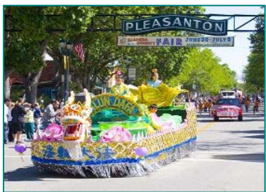
◆法轮功学员制作的花车

【明慧网】（明慧记者王英加州普莱森顿市报导）六月二十三日，美国旧金山湾区部份法轮功学员参加了在普莱森顿市（Pleasanton）举行的“阿拉米达县园游会游行”，其中，由法轮功学员组成的天国乐团和花车队备受瞩目。