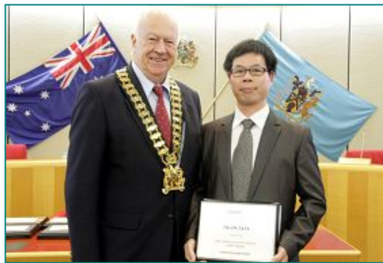
◆市长（左）在市政府议员会议上为法轮功团体代表颁奖

【明慧网】（明慧记者蕴韵澳洲悉尼报道）二零一二年六月二十七日晚七点，澳洲悉尼布莱克镇（Blacktown City）市政府为当地节日大游行获奖团体举行颁奖仪式，法轮功团体和法轮功学员组成的天国乐团已是第三次获得冠军。