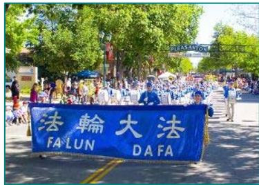
◆旧金山天国乐团应邀参加阿拉米达县园游会游行