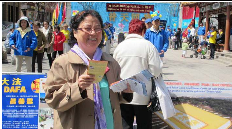
图：蒙特利尔庆祝法轮大法传世二十周年，七十多岁的金女士在发真相资料。