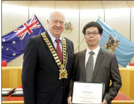
图：市长（左）在市政府议员会议上为法轮功团体代表颁奖

布莱克市市长艾伦·彭德尔顿说：“法轮大法的游行队伍一直是很棒的！我觉得非常壮观，色彩绚丽。他们是一群很好的人。”