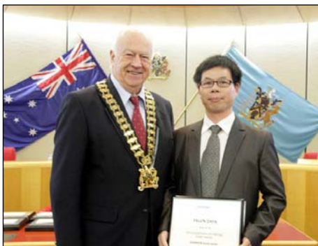
图：市长（左）在市政府议员会议上为法轮功团体代表颁奖

布莱克市市长艾伦·彭德尔顿说：“法轮大法的游行队伍一直是很棒的！我觉得非常壮观，色彩绚丽。他们是一群很好的人。”