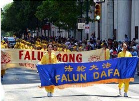
上图：法轮功游行队伍