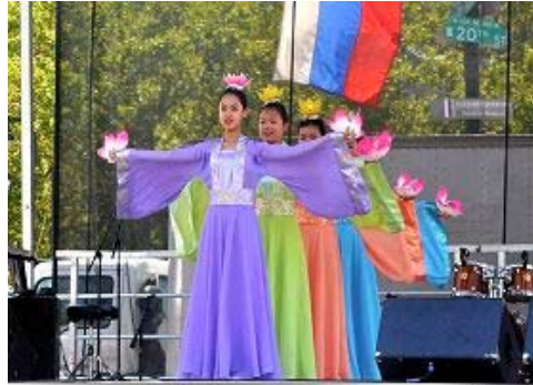
大费城明慧学校学生在表演莲花舞