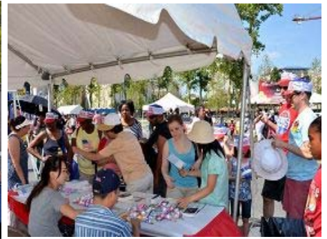
法轮功展位前人群络绎不绝