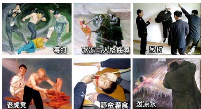
法轮功学员遭受的部分酷刑

名义上“610”是政府下属的一个办公室，可它并不是隶行政府职能的机构，干的是非法限定人身自由、劫持关押公民、指挥公安、安全局监听、监控、秘密绑架法轮功学员，干涉法律公正、强制洗脑、实施暴力、非法入侵民宅、策划恐怖行为、制造谎言、任意胡作非为、自立土政策，执有生杀大权。它既不隶政，建树政绩，它又超越宪法，取代法律，害民害国，是地地道道的非法组织。