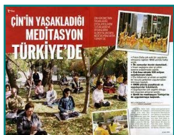
图五：土耳其著名杂志《新当代》介绍法轮功

【明慧网】法轮大法创始人李洪志师父，于 92 年向社会公开传功讲法，受到广大群众的欢迎。功法以炼功时不受场地时间的限制，以及无需意念引导等不同于其它气功的全新内容，令人耳目一新，独树一帜，到目前为止，包括港、澳、台在内的全国各地，都有自发性的群众炼功组织，并传遍欧、美、澳、亚四大洲，全世界约有一亿人在学法轮大法。”