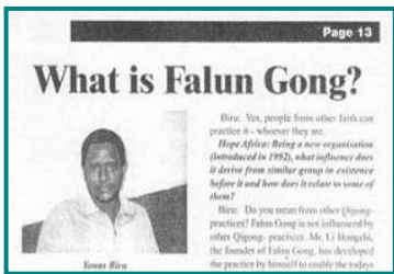
图四：希望非洲报：什么是法轮功？