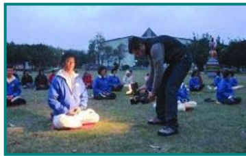
图三：意大利的媒体在台湾花莲县文化局前大草坪拍摄学员晨练