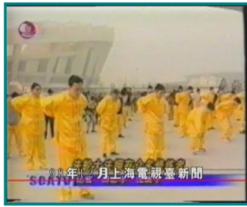
图一：中国上海电视台 1998 年 11 月 24 日报道法轮功