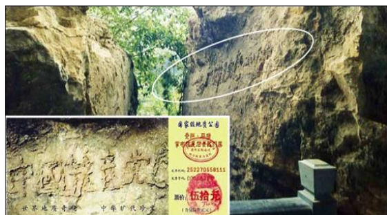
大图为“藏字石”的断裂面，小图为风景区的门票，国内媒体只报了前面的五个字，不敢报最后的“亡”字。

定有奇事发生，老天或以瑞兆示吉，或以凶相警世。今天，贵州平塘的“藏字石”是否也在向人们预示着天机呢？突现标语“中国共产党亡”，非同小可，绝非偶然。