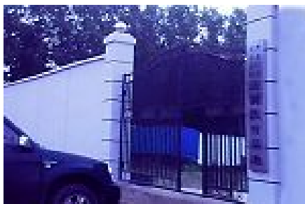
青龙山“法制培训基地”（洗脑班）

截至目前，据明慧网报道，被绑架到青龙山洗脑班共三十六人，70% 是女性法轮功学员。这些法轮功学员失去了正常的工作和生活，被剥夺了基本的自由和人权。由于青龙山洗脑班手段残忍，绝大部份被绑架的法轮功学员都被暴力“转化”，大多数学员除身体遭到残害留下疤痕外，精神普遍受到严重创伤。在此人间地狱暗无天日的煎熬期间，法轮功学员及家人们遭受了深重的精神、肉体和经济上的伤害，损失根本无法计算。