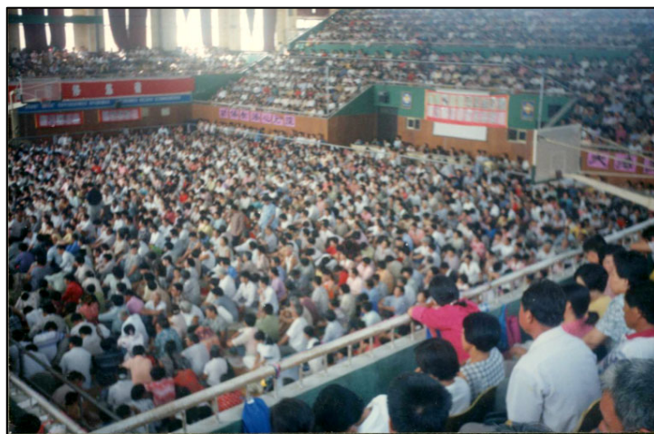
图：一九九八年八月份，来自青岛、潍坊、即墨、平度、莱阳、栖霞、海阳等地的四千五百多人在山东省莱西市体育馆内举行了法轮大法修炼心得交流会。整个体育馆内座无虚席，会场充满了祥和、慈悲。

因为当时家里人都知道我要回家，可是连着一周的时间就是找不到我，父母都要上济南去找我了。后来我跟家人说起这事的时候，奶奶特意嘱咐我：当时电话联系不到你的时候，我跟你妈就怕你被黑社会给害死了，就经常掉眼泪，现在你回来了，我们都高兴，你可别忘了那些帮助过你的人啊。我答应着。