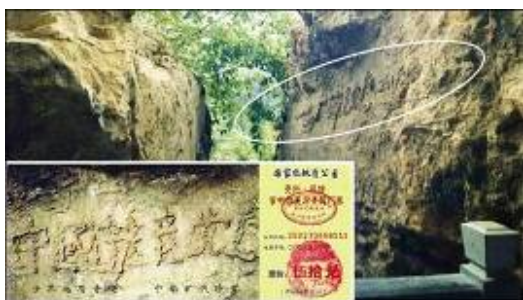
图为“藏字石”照片，小图为风景区门票。

2002 年 6 月，贵州省平塘县掌布风景区发现五百年前崩裂的巨石断面惊现“中国共产党亡”六个大字。经三批地质专家鉴定“藏字石”为 2.7 亿年前天然形成，“藏字石”的图片还被印在风景区的门票上。其实这就是老天爷借着石头告诉咱老百姓，上天要灭这个总是贪污腐败害咱们老百姓的中共邪党，所以说“天灭中共”是天意。只有顺应天意，声明“三退”保命才是明智选择。