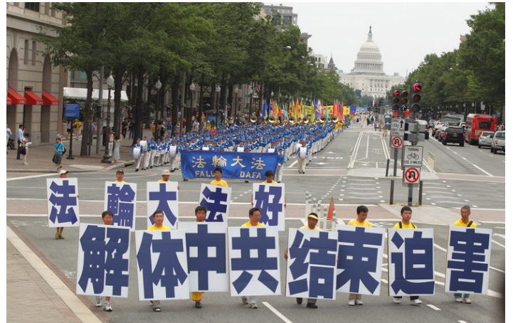
2012 年 7 月 13 日，法轮功学员在美国首都华盛顿举行游行集会。

汪志远指出，随着时间推移，中共迫害法轮功的罪恶在中国和国际社会更广泛曝光，中国大陆全民反迫害的序幕已经拉开。近期先后发生了河北泊头周官屯村三百户村民、河北唐海县五百六十二位民众，黑龙江逾一万五千人按手印为法轮功学员呼吁的事件。追查国际收到越来越多的中共基层和高层官员提供的迫害证词。很多参与迫害的警察也意识到自己触犯了群体灭绝罪，将