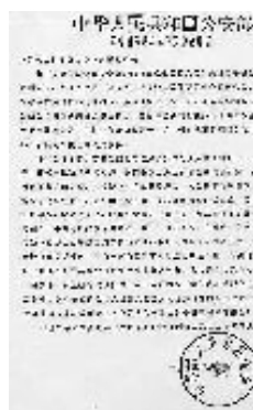
中华见义勇为基金会的感谢信

这一段神奇的描述, 出自一封感谢信, 这封信是由中国公安部中华见义勇为基金会, 在一九九三年, 写给中国气功科学研究所的。而这封感谢信, 又在《人民公安报》上被郑重地提及。一九九三年九月二十一日日的《人民公安报》报道了一位中国的传奇人物亲率弟子, 为近百名中国第三届见义勇为先进分子表彰大会代表做免费治疗。治疗收到了非常好的效果, 受到了一致好评。为此, 中华见义勇为基金会曾专门致函中国气功科学研究所和这位传奇人物, 表示感谢。