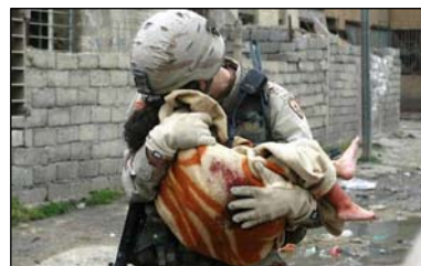
图：美国大兵与伊拉克小女孩

网上曾流行一张照片“美国大兵与伊拉克小女孩”，讲述的是在伊拉克，恐怖分子袭击美国士兵，结果旁边一个伊拉克小女孩受伤了，一名美国士兵抱着小女孩