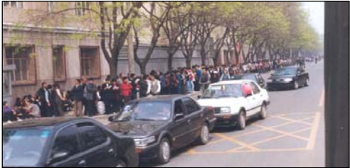
图：和平上访现场。注意：街道上汽车、自行车都可以正常行驶，社会秩序正常。

都被法轮功学员清扫干净了。国际社会将4•25上访称作“中国上访史上最理性、最平和的上访”。