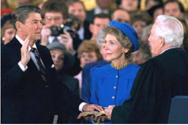
图：美国前总统里根对神宣誓

在科技发达的西方国家，“无神论”从来不是社会的主流，相反，对神的信仰在日常生活中普遍存在，例如在美国，民众将国家的强大归于“神保佑美国”，从美国诞生至今的 44 位总统，全都相信神的存在。正如杰弗逊总统所说：没有对神的信仰，任何国家都不可能治理好，我作为这个国家的总统，必须树立榜样。