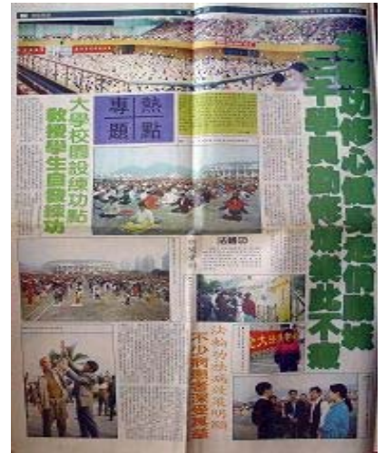
图：一九九八年十二月三十一日，中国《深星时报》版整版篇幅介绍法轮功及法轮功祛病健身的神奇功效。

一九九八年九月，国家体育总局抽样调查 12, 553 位法轮功学员，结果表明：疾病痊愈和基本康复率 77.5%，好转率 20.4%，祛病健身总有效率高达 97.9%。一九九八年下半年，部份人大离退休干部，在对法轮功做了长达数月的详细调查后，得出结论：“法轮功于国于民有百利而无一害”。