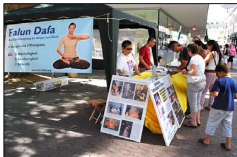
图：在繁华的美因茨步行街上征签

【明慧网】二零一二年八月十八日，德国法轮功学员在奥芬堡市、美因茨的步行街、拜罗伊特市中心同时举办信息日，传播法轮功反迫害真相，中共血腥活摘法轮功学员器官的恶行，震惊德国民众，人们纷纷签名支持法轮功学员反迫害。