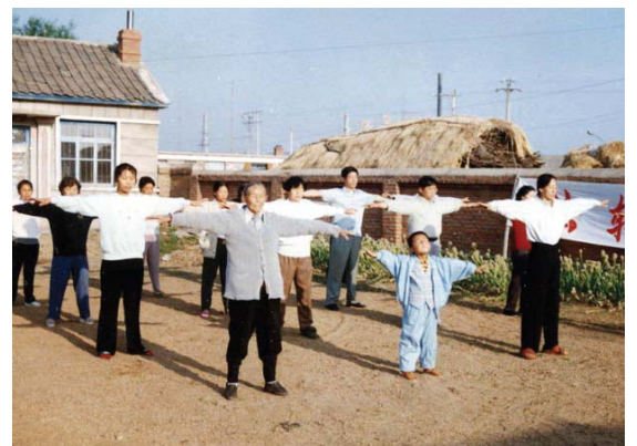
历史图片：东北农村法轮功学员晨炼

小孙子七岁那年，小阴茎包头上长一硬核，医生说等长大了手术，孙子和奶奶常念大法《洪吟》，