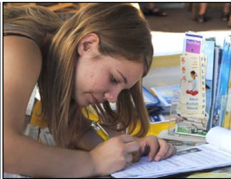
图：德国多个城市熙熙攘攘的人群纷纷签名，支持法轮功学员反迫害