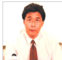
前沈阳市司法局局长 韩广生