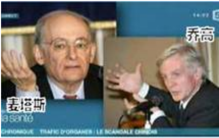
视频截图：2010年1月7日，收视率很高的法国电视5台专题报道，揭露中共活体摘取大量法轮功学员器官进行贩卖的罪行。

中共是一个做恶没有底线的犯罪集团。它当年在发生大饥荒、饿殍遍野的时候，不但不予救济，反而派出军队封锁道路，禁止百姓逃荒要饭，致使3000万人活活饿死；在天安门发生民主运动的时候可以用坦克的履带、毒气弹、开花弹来屠杀手无寸铁的学生；在镇压法轮功的时候，可以活体摘取法轮功学员的器官牟利，然后把仍有心跳和呼吸的法轮功学员推入焚尸炉烧死，对于这个党来说，残忍嗜血、天良丧尽，从隐瞒萨斯病（SARS，大陆称为