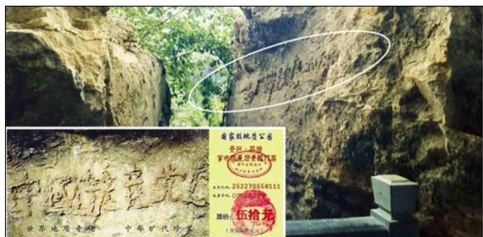
上图为“藏字石”照片，小图为风景区门票。

专家一致认为，掌布河谷景区“藏字石”上的字位于距今2亿7千万年左右的二叠统栖霞组深灰