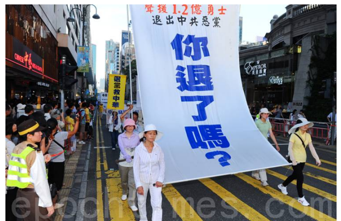
图:2012 年 7 月 29 日香港声援一亿二千万三退大潮。

目前中国大陆的社会表面变化形势并不剧烈，但却在一点点地稳步地向前推进，每过一段时间就可能爆发一些预料不到的事件，但件件都对中共不利，情况越来越向正义的一方倾斜，而中共已无力扭转局面，也许将来出现的某个突发性事件就断送了中共的命运，就如同苏联东欧剧变一样叫人难以预料。现在社会表象的模糊不清与扑朔迷离，考验着每个人的智慧与悟性。如何选择，决定了每个人的未来。