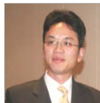
前驻悉尼外交官 陈用林