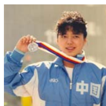
前奥运游泳名将 黄晓敏