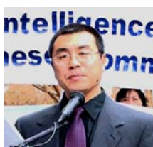
前国安部对外情报官 李凤智