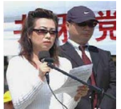
图：2006年在白宫附近证人安妮与皮特现身揭露中共活体摘取法轮功学员器官的滔天罪行。

加拿大前亚太司司长大卫·乔高和人权律师大卫·麦塔斯组成独立调查组，他们经过了两个多月取得五十多个证据，于2006年7月6日公开了一份关于“中共活体摘取法轮功学员器官”的调查报告，结论是：从2000年开始，活体摘取法轮功学员器官贩卖牟利的系统犯罪一直发生着，而且遍及