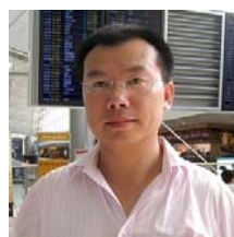
前人民日报副主任 邱明伟