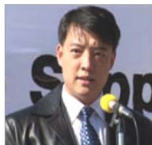
前天津 610 官员 郝凤军