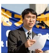
前首都师范大学教授孙延军