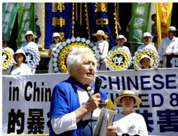
前加拿大资深国会议员西玛·霍特在2006年7.20聚会上发言

教会这四部份,在法轮功问题上都没有意识到自己的责任,所以迫害才会持续这么长的时间。法轮功学员坚持不懈地通过各种方式,把迫害真相披露出来,成为终止这场迫害的关键。