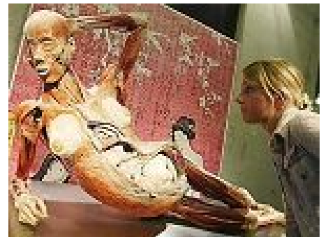
有孕妇躺着被切开肚子，腹中胎儿也都清晰可见（上图）。

虽说已有证据证明锦州公安局的心理学研究中心所进行的器官移植对象就是法轮功学员，可是尚无证据确认这些被摘取了器官后的遗体的走向。但是无论大连的这两家“生物塑化公司”所使用的尸源是否是法轮功学员，或是否全是法轮功学员，单就将人体制作成人体标本用以牟利的行为就足以说明参与者的血腥与残忍。