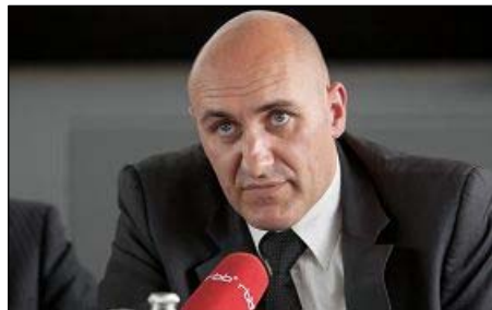
图：反强摘器官医生协会发言人法国医生金认为活摘器官完全背离医学原则

二零零六年三月初，中共在沈阳市苏家屯秘密集中营关押六千名法轮功学员并摘取活体器官的暴行被海外媒体曝光，英国器官移植学会伦理委员会主席史蒂芬·威格摩尔教授随即谴责在中国的器官移植是一项“无法接受”的侵犯人权行为，并呼吁联合国及世界卫生组织展开调查。