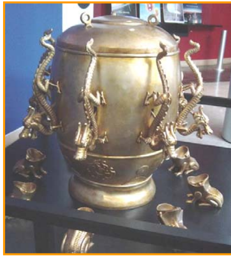
图：中国古代科学异常发达。东汉时期张衡发明了世界上第一台预测地震的候风地动仪，比欧洲早 1700 多年。