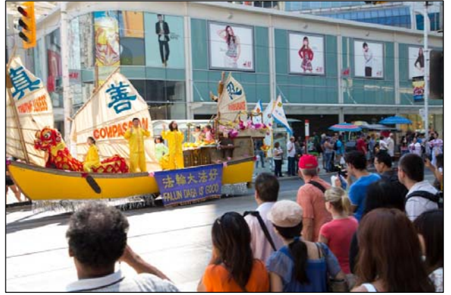
图：法轮功学员和民众在多伦多市中心举行大游行

权——正发生在中国的严重人权践踏。”他说，“随着越多人知道迫害，将会有越来越多的人与你们站在一起抗争，直到我们都有自由。”