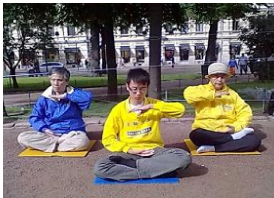
图：法轮功学员演示功法

【明慧网】法轮功（又称法轮功）以“真、善、忍”为修炼原则，加上五套简单易学的功法，使炼功人身心升华，深受世界各族裔人们的喜爱。在芬兰，也有很多法轮功学员，他们自己炼功受益，也乐于和更多人分享法轮大法的美好，并揭露中共对善良的法轮功修炼者长达十三年的残酷迫害。法轮功学员经常在赫尔辛基的海滨公园介绍功法和揭露中共的迫害。二零一二年八月十一日，法轮功学员再次来到这里。横幅和展板还没有摆好，有人就主动来签名表示支持法轮功。很多路人与游客陆续从展位经路过，