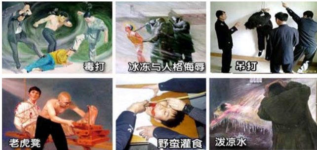
法轮功学员遭受的部分酷刑

名义上“610”是政府下属的一个办公室，可它并不是隶行政府职能的机构，干的是非法限定人身自由、劫持关押公民、指挥公安、安全局监听、监控、秘密绑架法轮功学员，干涉法律公正、强制洗脑、实施暴力、非法入侵民宅、策划恐怖行为、制造谎言、任意胡作非为、自立土政策，执有生杀大权。它既不隶政，建树政绩，它又超越宪法，取代法律，害民害国，是地地道道的非法组织。