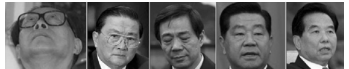
上图：迫害法轮功的元凶江泽民、罗干、薄熙来等人已经在海外多个国家被起诉。

2012年3月23日，曾被周永康列为最高封锁级别的敏感词“活摘器官”相关词在百度上一度解禁，大量揭露中共活摘法轮功学员器官暴行的文章出现在该网站上。随后，《转