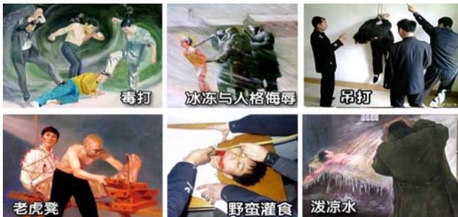
法轮功学员遭受的部分酷刑

名义上“610”是政府下属的一个办公室，可它并不是隶行政府职能的机构，干的是非法限定人身自由、劫持关押公民、指挥公安、安全局监听、监控、秘密绑架法轮功学员，干涉法律公正、强制洗脑、实施暴力、非法入侵民宅、策划恐怖行为、制造谎言、任意胡作非为、自立土政策，执有生杀大权。它既不隶政，建树政绩，它又超越宪法，取代法律，害民害国，是地地道道的非法组织。