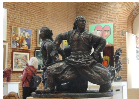
图：本文作者的陶土雕塑《威武矫健的蒙古族小伙子》46x45x36 (cm)

我用陶土雕塑了这个作品，把三个男子塑成一个组雕，他们围成一圈，没有间隔，威武阳刚。这组雕塑作品参加了二零一一年法国南方与塔河省第三十三届艺术沙龙展。◇