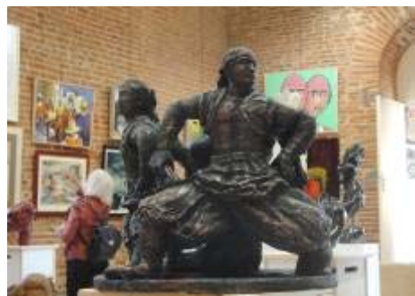
图：本文作者的陶土雕塑《威武矫健的蒙古族小伙子》46x45x36 (cm)

我用陶土雕塑了这个作品，把三个男子塑成一个组雕，他们围成一圈，没有间隔，威武阳刚。这组雕塑作品参加了二零一一年法国南方与塔河省第三十三届艺术沙龙展。◇