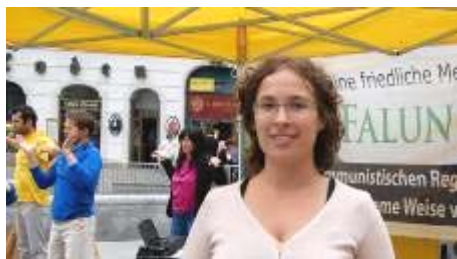
图：今年七月，茱莉亚女士在维也纳 Michaelerplatz 广场参加讲真相活动。