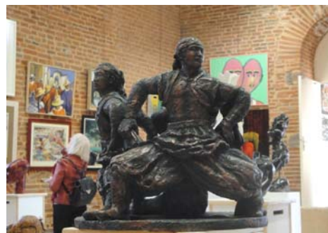
图：本文作者的陶土雕塑《威武矫健的蒙古族小伙子》46x45x36 (cm)

我用陶土雕塑了这个作品，把三个男子塑成一个组雕，他们围成一圈，没有间隔，威武阳刚。这组雕塑作品参加了二零一一年法国南方与塔河省第三十三届艺术沙龙展。◇