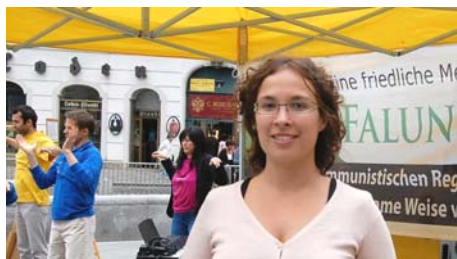
图：今年七月，茱莉亚女士在维也纳 Michaelerplatz 广场参加讲真相活动。