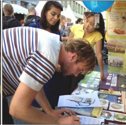
左：丹麦法轮功学员参加游行，微笑着向沿途民众展示“法轮大法好！” 右：许多民众与法轮功学员交谈、了解真相后，纷纷签名支持法轮功。