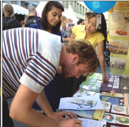
左：丹麦法轮功学员参加游行，微笑着向沿途民众展示“法轮大法好！” 右：许多民众与法轮功学员交谈、了解真相后，纷纷签名支持法轮功。