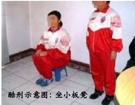
酷刑示意图：坐小板凳

只不过不为外界所知罢了。例如马三家劳教所有一种非常邪恶的酷刑“坐小凳”。(下图)