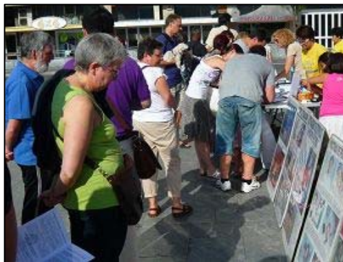
图:圣赛巴司蒂安市民及来自世界各地的游客签字声援法轮功反迫害

【明慧网】二零一二年八月四日下午,法轮功(又称法轮大法)学员在西班牙北部圣赛巴司蒂安市向过往行人讲真相,呼吁人们声援在中国无辜遭迫害的法轮功修炼者。看到法轮功学员摆放的图片展板和横幅,很多人在这些揭露酷刑和迫害的图片前驻足,阅读展板上的文字。学员们派发传单,详细讲述十三年来发生在中国的这场浩劫,并呼吁人们签名反迫害。与此同时,一些学员演示法轮功的五套功法。