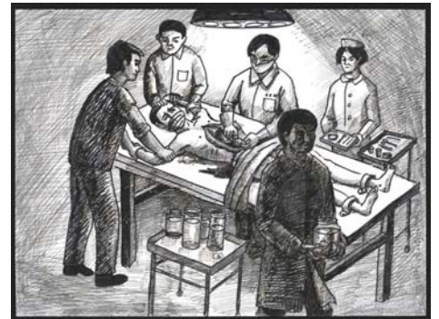
中共活体摘取法轮功学员器官谋取暴利模拟图

2012 年 7 月在加拿大出版的《国有器官》（State Organs: Transplant Abuse in China）一书中，多位世界医学界权威和专家探讨了中共动用国家机器介入器官移植的现象。其中被誉为全球科技界最有影响力的十大人物之一、美国宾夕法尼亚大学生物伦理学中心主任亚瑟·卡普兰在书中提到：中国大陆活摘器官“为需求而杀人”的现象普遍存在。书中收录了多位在国际器官移植领域的著名人士和权威医生的文章。这些文章从