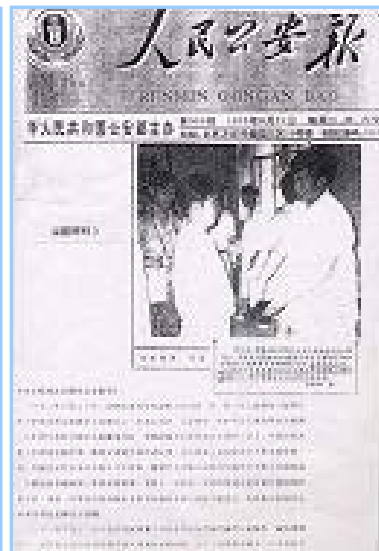
■ 左图为中国公安部的感谢信；右图为《人民公安报》肯定法轮功。

一九九三年九月二十一日，中华人民共和国公安部主办的《人民公安报》，专题报导《法轮功为见义勇为先进分子提供康复治疗》，并称这些先进分子“经调治后普遍收到了非常好的效果”。