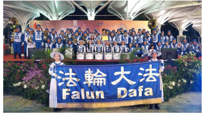
由法轮功学员组成的天国乐团首次参与了由雪兰莪州政府举行国庆游行，获得民众欢迎。

以及筛选最佳游行队伍和乐团。天国乐团获得主办方颁发安慰奖，最后更被安排压轴演奏马来著名民谣《Rasa Sayang》，来结束当天的庆典活动。◇