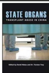
图：《同谋者们》海报 中：著名人权律师大卫·麦塔斯 右：《国有器官》封面