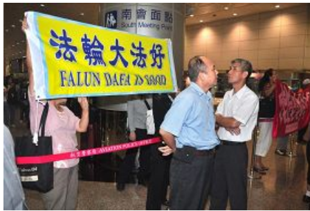
图：法轮功学员在桃园机场拉起横幅

据民视报导，陈云林原本九月十一日下午参观华山创意园区及松山文创园区，但因场外几百名法轮功学员、独派团体及声援香港反洗脑行动的网友一起聚集在华山创意园区表达抗议，陈云林最后以身体不适，临时取消二个行程。访问团的其他团员仍然按照原定计划参访华山文创园