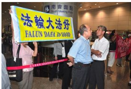
图：法轮功学员在桃园机场拉起横幅

据民视报导，陈云林原本九月十一日下午参观华山创意园区及松山文创园区，但因场外几百名法轮功学员、独派团体及声援香港反洗脑行动的网友一起聚集在华山创意园区表达抗议，陈云林最后以身体不适，临时取消二个行程。访问团的其他团员仍然按照原定计划参访华山文创园