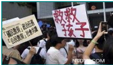
图:香港九万人反洗脑教育大游行