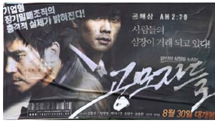
上：揭露中共活摘器官的韩国电影《同谋者们》海报。