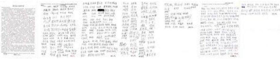
图：申诉人共三百七十六位村民签名（签名图片）

当地纯朴的村民们出于义愤，先是自发组织了两卡车人赶去东陵监狱讨公道，在监狱不给任何答复的情况下，五个村的三百七十六人在揭露监狱迫害的申诉信上签上了自己的名字。