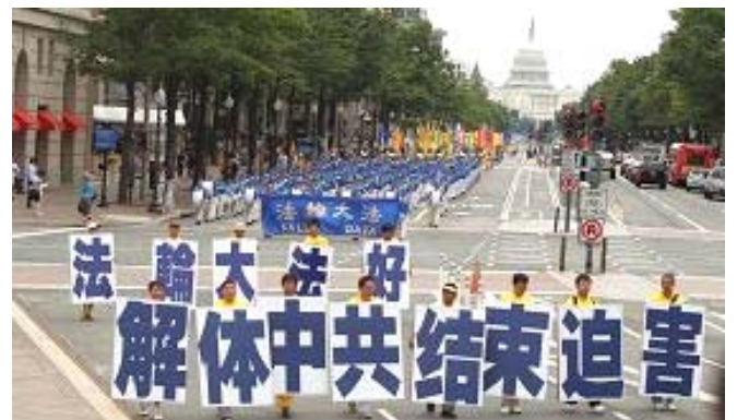
▲2012 年 7 月 13 日，法轮功学员在美国首都华盛顿举行以“解体中共，停止迫害法轮功”为主题的游行集会。

汪志远说：“这些变化说明，中共经营多年的红色恐怖在迅速崩溃，全民反迫害的大潮正在兴起。”