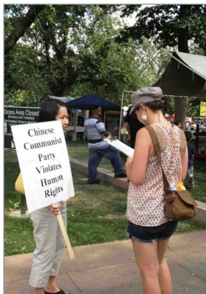
图：科州风味节上，游客签名谴责中共活摘器官暴行成小组，通常很多人同时要签名，所以准备多个签字板才能尽量让大家同时进行。多数的人都已经听说过中共对法轮功的迫害和中共活摘人体器官的暴行，他们主动签名并希望了解更多法轮功真相。◇

往年的风味节组织者曾把讲真相的法轮功学员挡在外面。今年，当学员在围栏外向过往的行人征集签名时，工作人员主动和组织者沟通，邀请学员们进到场内。很多游客看到标志牌就过来询问：“我可以签名吗？”学员们分