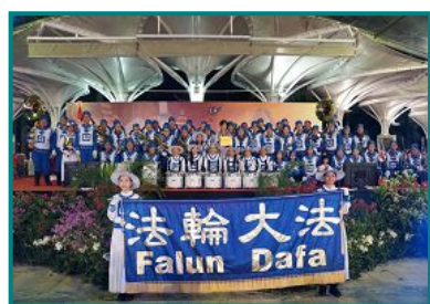
图：首次参与这次国庆游行的天国乐团获得主办方颁发安慰奖。