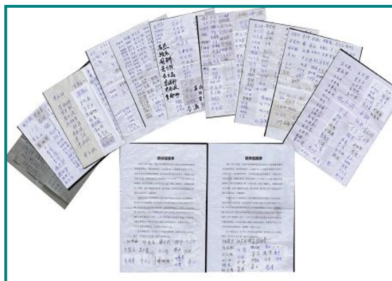
附：河北省第三批共计 903 位民众签名声援正定李兰奎

历史终将证明，暴力与邪恶从来无法扼杀良知和正义。在这最后的历史关头，参与迫害者若再不能猛回头，补偿自己的罪过，将走向最为悲惨的下场。◇