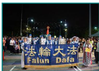
图：天国乐团被安排压轴演奏马来著名民谣《Rasa sayang》，获得民众欢迎。