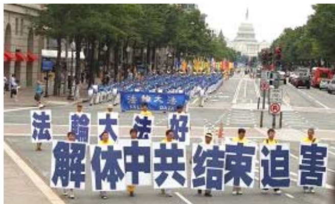
▲2012 年 7 月 13 日，法轮功学员在美国首都华盛顿举行以“解体中共，停止迫害法轮功”为主题的游行集会。

汪志远说：“这些变化说明，中共经营多年的红色恐怖在迅速崩溃，全民反迫害的大潮正在兴起。”